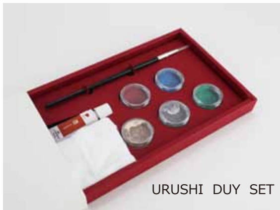
URUSHI DUY SET