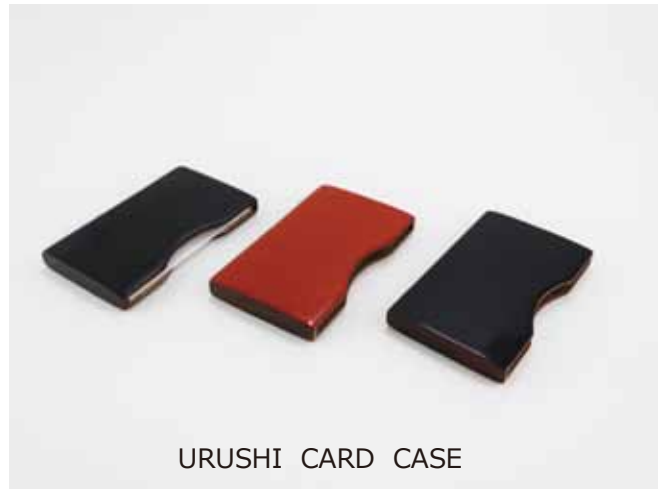
URUSHI CARD CASE