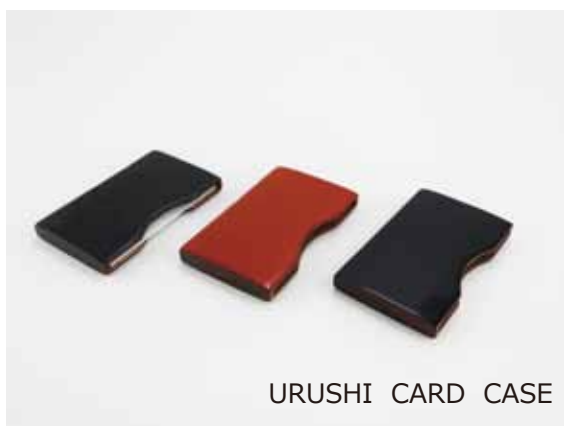
URUSHI CARD CASE