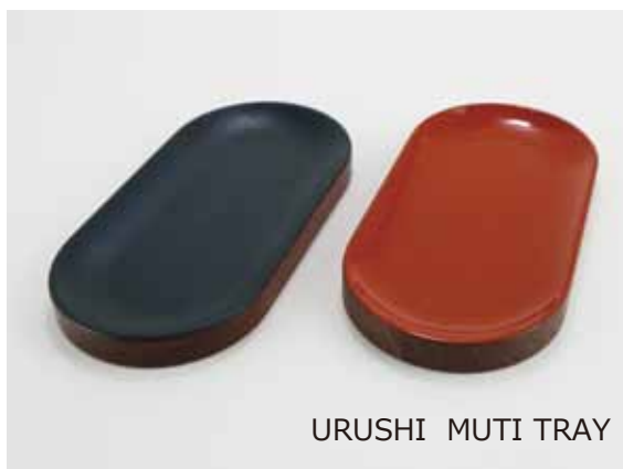
URUSHI MUTI TRAY