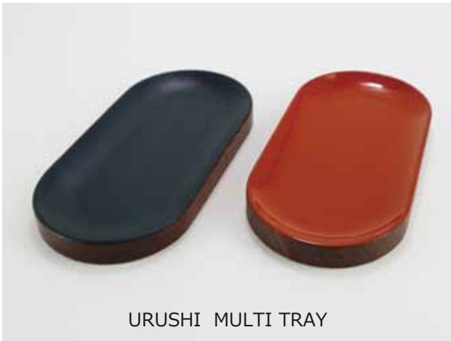
URUSHI MULTI TRAY